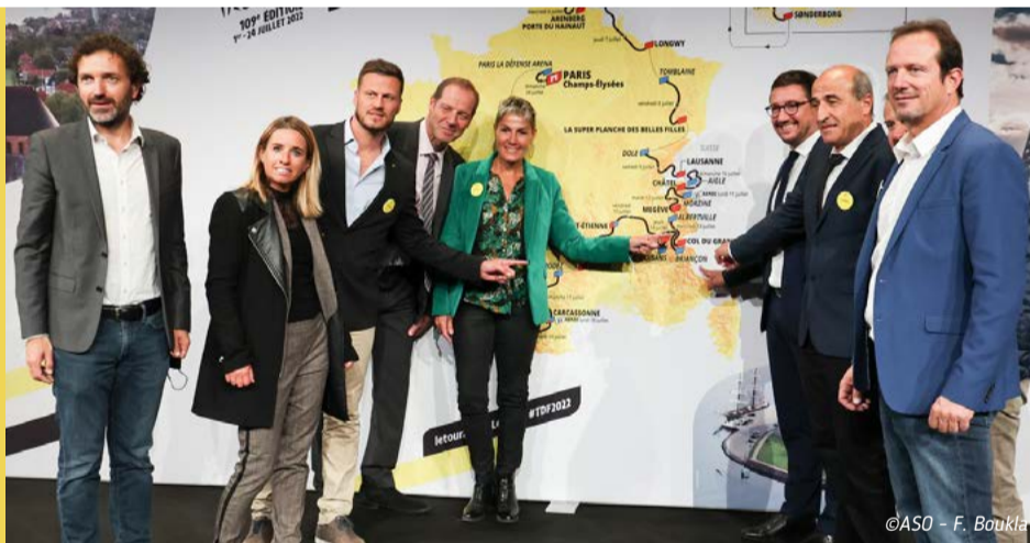
Dévoilé du tracé 2022 à Paris en présence d'une délégation haut-alpine.

12 e étape Briançon-l'Alpe d'Huez Pour cette réplique exacte du Briançon-Alpe d'Huez de 1986, les coureurs franchiront à nouveau le Lautaret et le Galibier pour la 2 e fois en 2 jours.