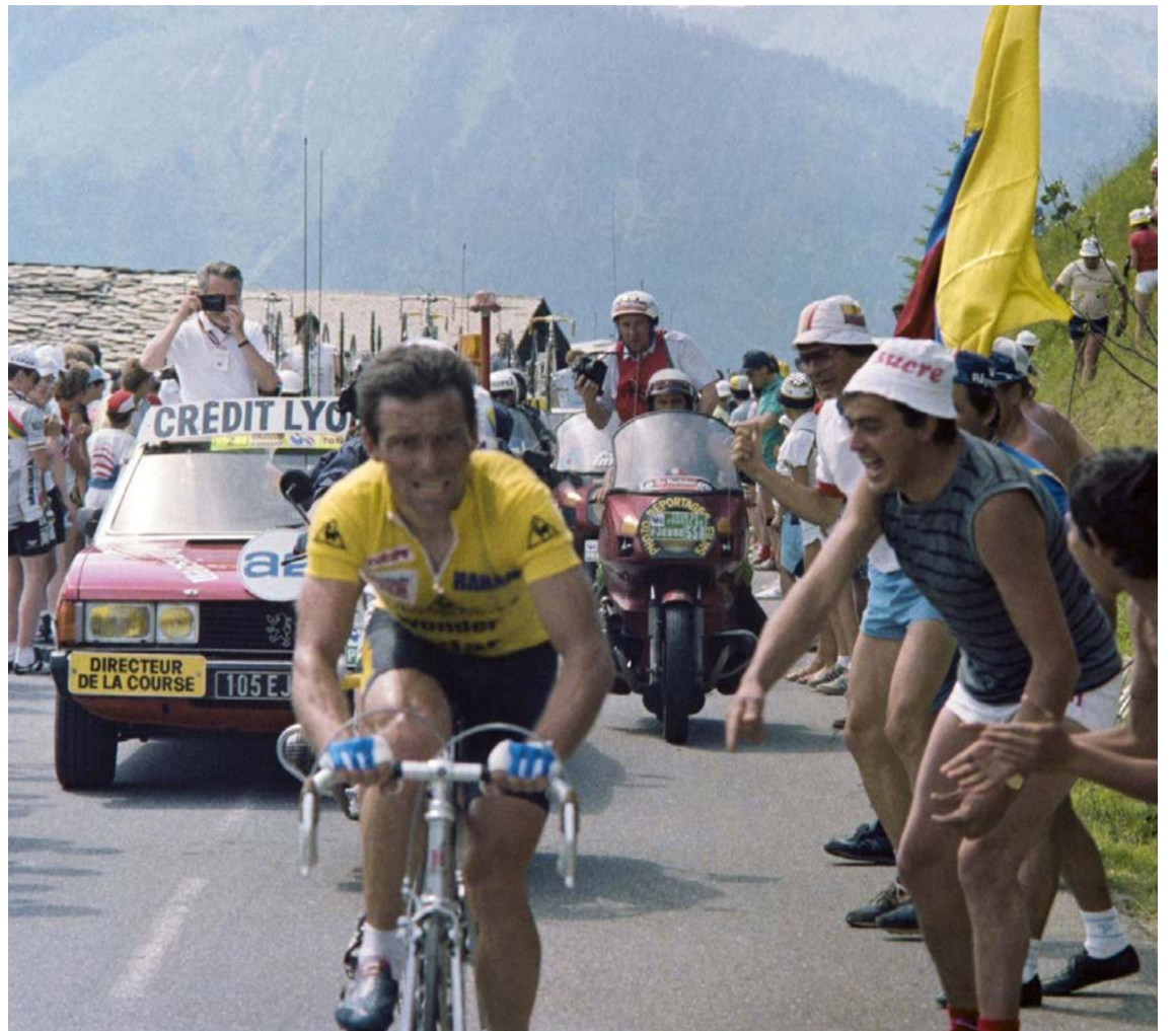
Bernard Hinault lors de l'étape Gap-Serre Chevalier (Col du Granon), Tour de France 1986.

C'était il y a 36 ans, en 1986, pour la première fois le Tour empruntait la rude pente du col du Granon et traçait l'arrivée de cette étape anthologique à 2 413 m. Un record d'altitude détrôné en 2011 par une arrivée au sommet du Galibier à 2 642 m. 36 ans, c'était hier dans les mémoires de nombreux Chaffrelins, spécialistes ou non de vélo. Parce que dans ce qu'elle charrie de ferveur populaire, dans ce qu'elle représente de culture française, dans ce qu'elle porte d'événement national, la Grande Boucle s'affranchit des frontières des experts et touche chaque résident d'un territoire, d'un village, d'un hameau traversé par le peloton et son leader jaune. À Saint-Chaffrey, on se souvient qu'en 1986, peu après être parti de Gap, l'Espagnol Eduardo Chozas se lançait dans un raid solitaire qu'il concluait victorieusement au sommet de ce col hors catégorie. L'histoire retient également que sur cette étape alpestre inédite, Bernard Hinault passa sa dernière journée en jaune, laissant définitivement les commandes du classement général à son coéquipier américain, Greg LeMond. Dans la vallée de la Guisane, on parle encore de la liesse en ce jour à la gloire des héros de juillet et l'on s'apprête cet été à célébrer le retour du Tour en sa plus haute arrivée 2022. Un événement, même si le Tour est un peu chez lui en vallée de la Guisane tant il a fait étape ici. Il reste, encore et toujours, une aubaine pour l'économie locale et la notoriété de la destination touristique.