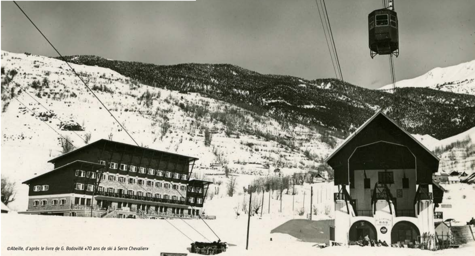
©Abeille, d'après le livre de G. Bodovillé «70 ans de ski à Serre Chevalier»

17 avril à 20h au Monêtier les Bains Féerie des Eaux.