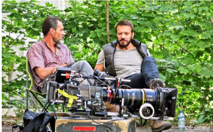
Samuel Le Bihan en tournage à Serre Chevalier.

Face au déficit de relation et de concertation entre les acteurs du tissu économique de Serre Chevalier Briançon, l'office de tourisme en s'appuyant sur les associations professionnelles du territoire (Pro Serre Che, les Enseignes de Briançon, Club des Hôteliers...), a développé l'action « Réseaux Pro ». Un poste a même été créé au sein de l'office pour animer ce réseau, développer des outils de mise en relation et d'échanges (rencontres, visioconférences, newsletters, groupes WhatsApp, Facebook dédié...) et des contenus spécifiques (informations sanitaires, animations communes, communication pour les 80 ans de la station...). L'objectif étant de fédérer les socioprofessionnels afin d'œuvrer ensemble et dans la même direction pour le développement de la station.