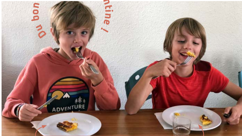
Les assiettes repartent enfin vides en cuisine !

Signe que le nouveau prestataire du restaurant scolaire (et du restaurant des aînés), la Société Alpine de Boucherie (SAB), ravit les palais des demi-pensionnaires de l'école. Gourmets, les enfants apprécient le tour de main de cette équipe de cuisiniers qui utilise des produits locaux, des fruits et légumes de saison, du pain bio (boulangerie Au Bon Lamé), des fromages et laitages des fermes régionales. Des menus qualitatifs, équilibrés, goûteux, adaptés aux enfants, proposés sans augmentation de tarif. La satisfaction est unanime du côté des convives comme des parents qui réclamaient depuis longtemps une amélioration du contenu des repas.