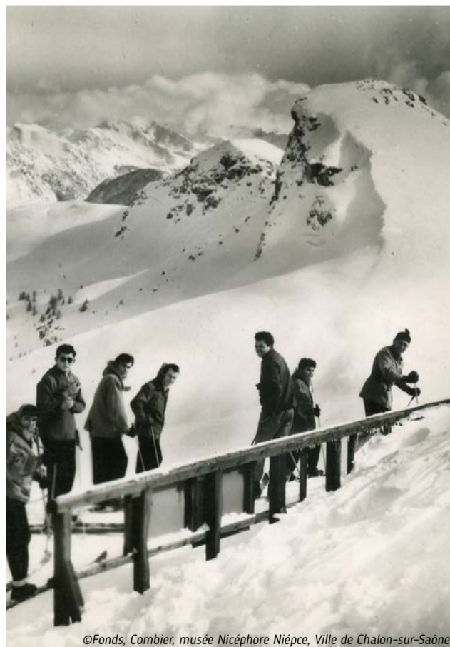
Sommet du Téléphérique - Le Rocher Blanc