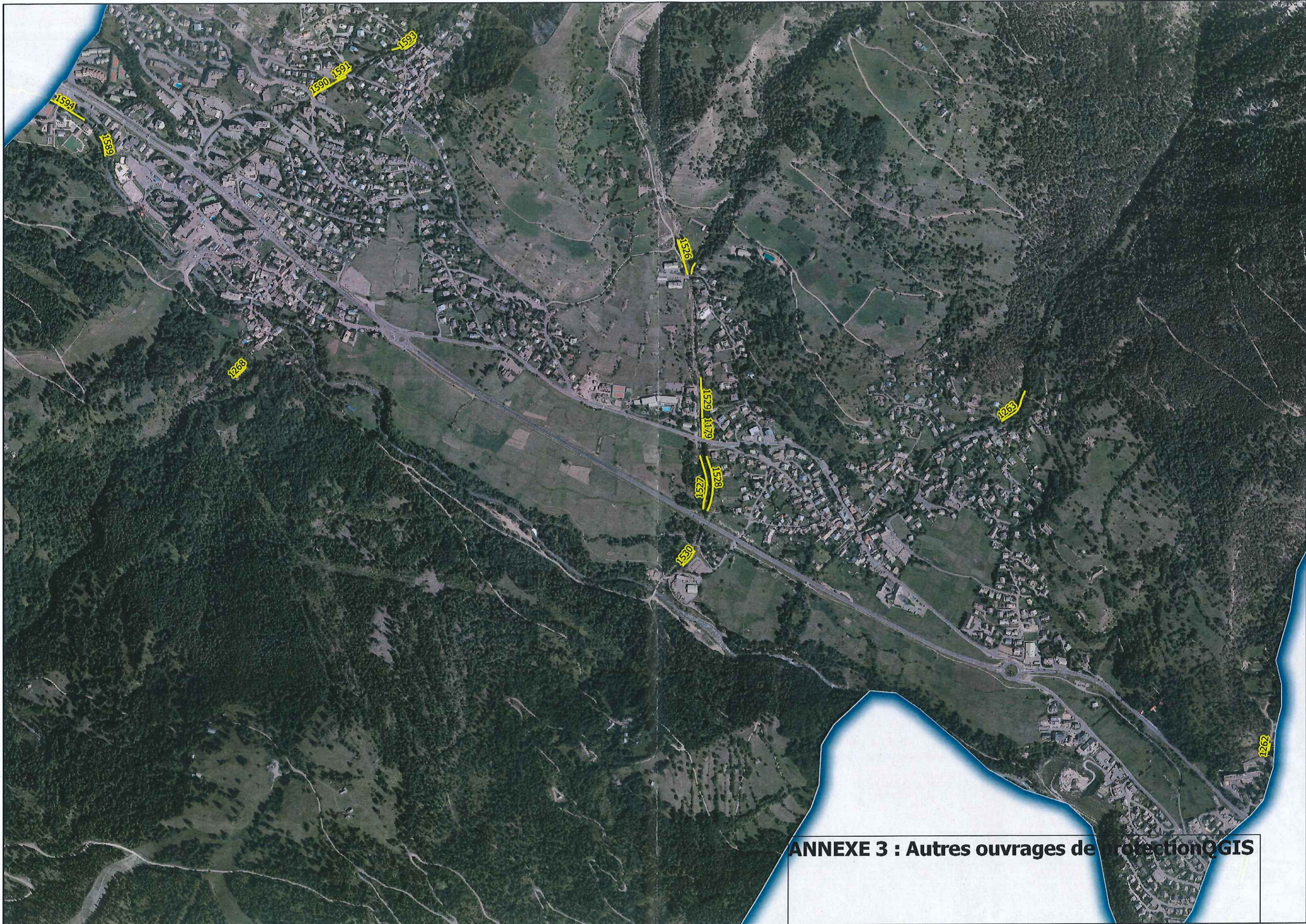
ANNEXE 3 : Autres ouvrages de protection GIS