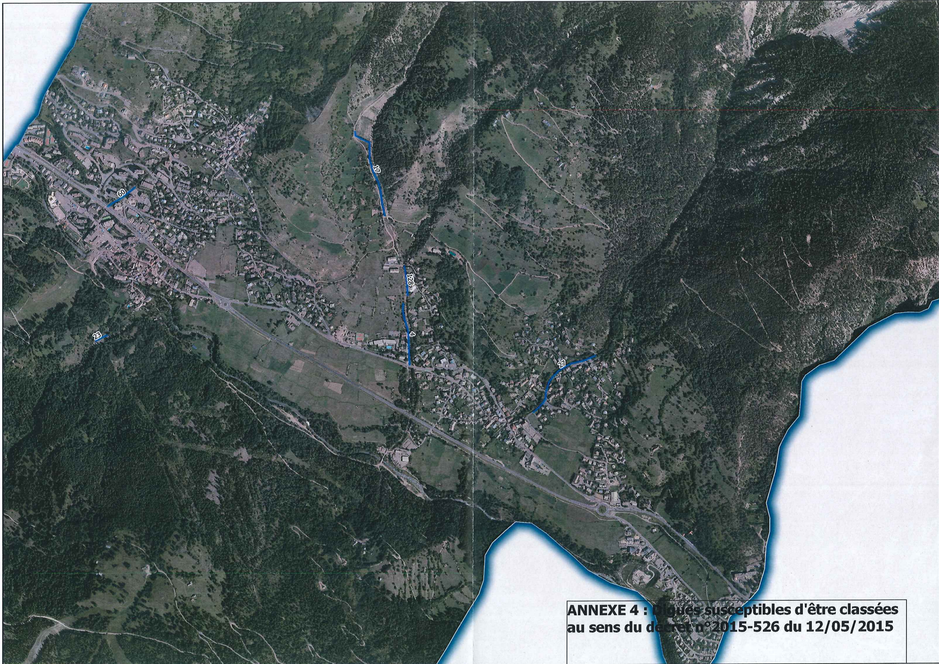
ANNEXE 4 : Rivières susceptibles d'être classées au sens du décret n°2015-526 du 12/05/2015