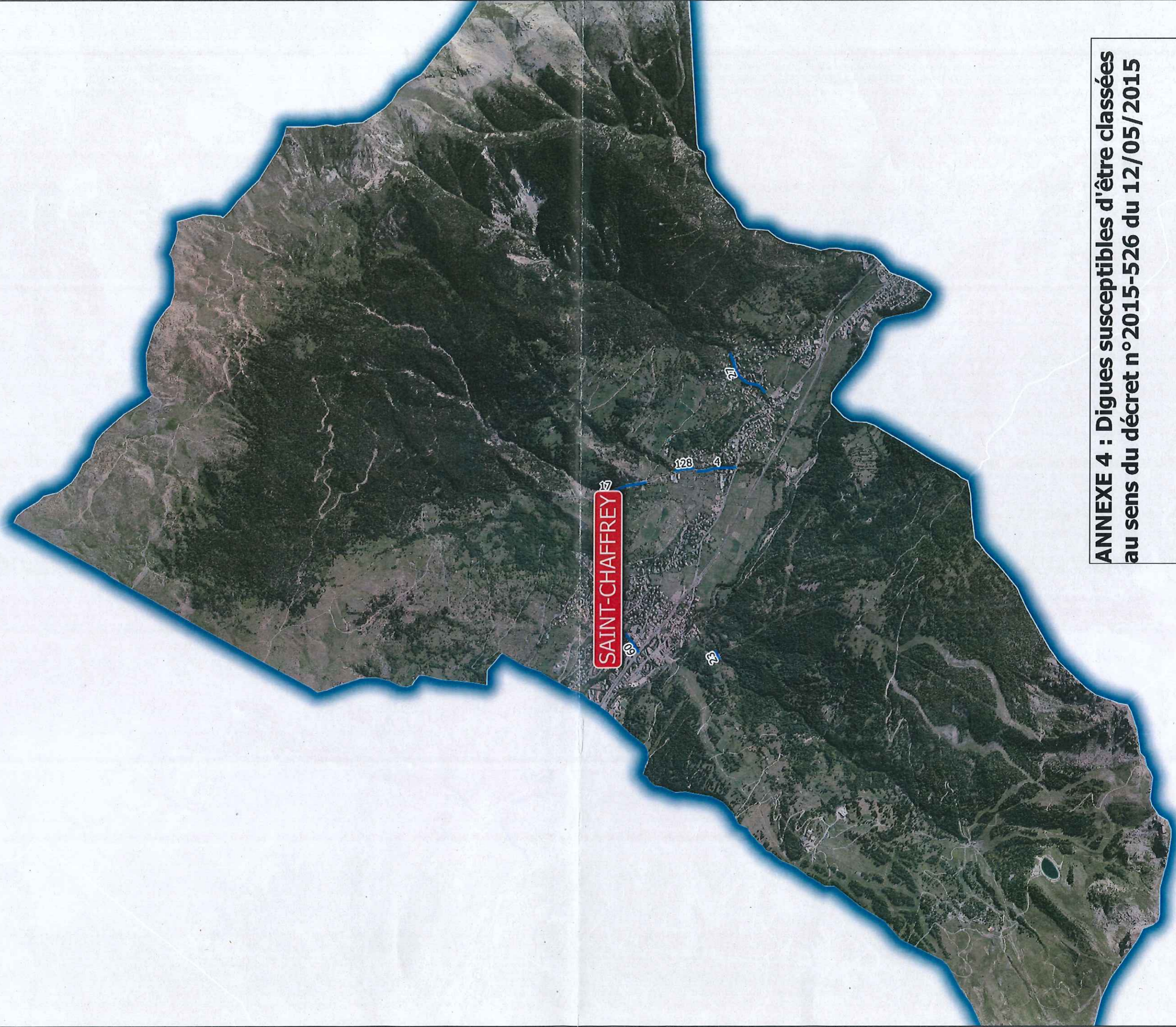
ANNEXE 4 : Dignes susceptibles d'être classées au sens du décret n° 2015-526 du 12/05/2015